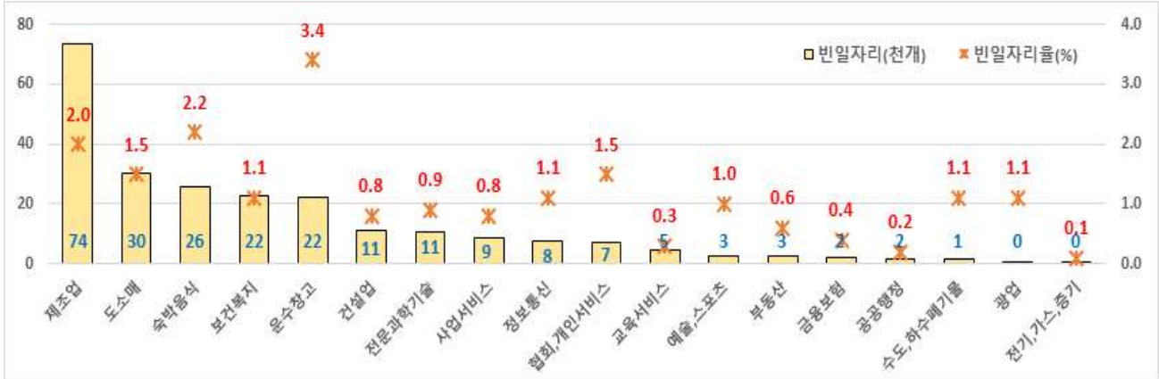
【 산업별 빈일자리수 및 빈일자리율 현황(% , 천개, '22.6월) 】