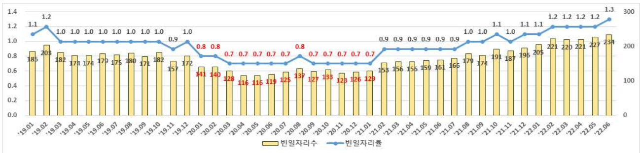
【 빈일자리수 및 빈일자리율 추이(% , 천개) 】