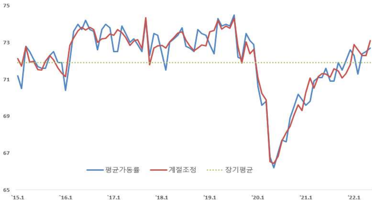
〈 중소기업 평균가동률 추이 〉