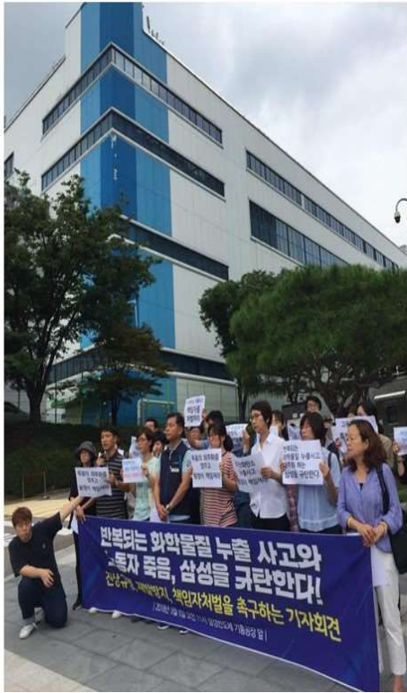
2018 삼성 기흥 이산화탄소 누출사고