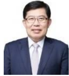
윤창현 국민의힘 의원

존경하는 국민여러분, 내외 귀빈 여러분 안녕하십니까, 국민의힘 비례대표 국회의원 윤창현입니다.